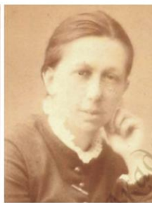
Юлия Всеволодовна Лермонтова (1846-1918).