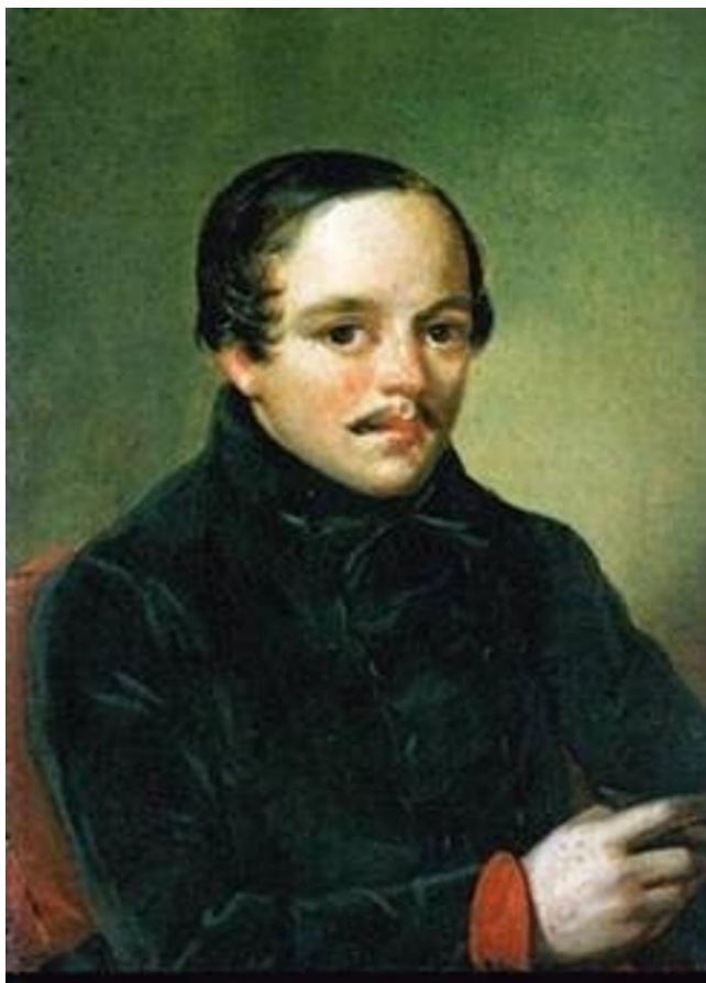
Ил. 82. Лермонтов в юности. Копия с неизвестного портрета работы П. Е. Заболотского, 1840 47 .

Лермонтов давно влюблялся и пытался волочиться за барышнями. Но как мы помним, в Середниково его не воспринимали как молодого юношу, он оставался милым забавным мальчиком, горячо любимым своей бабушкой – всеми уважаемой Елизаветой Алексеевной Арсеньевой.