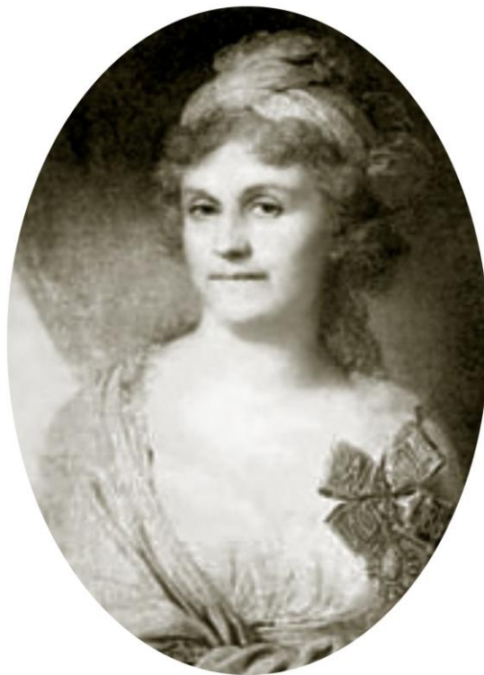
Ил. 79. Дарья Александровна Валуева. Художник: В. Боровиковский.

Дарья Александровна Валуева в 1818 году была шестидесятилетней вдовой скончавшегося в 1814 году известного всей Москве Петра Степановича Валуева (1743-1814) - действительного тайного советника (1798), сенатора (1796), обер-церемониймейстера при императоре Павле I, начальника московского дворцового управления и Кремлевской экспедиции, человека близкого к императорскому двору. Валуев имел свои поместные земли, а в 1796 году был награжден Павлом I ещё тысячью душ крестьян 27 .